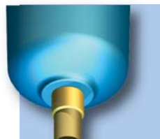
Purga manual Estándar: serie CF (02-12) Opcional: serie SF, PF, HF, UF (02-12)