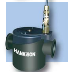
Indicador de aceite Opcional: CF (02-17)