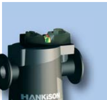
Indicador de presión diferencial con visualización en color Estándar: serie SF, PF, HF, UF (02-07)