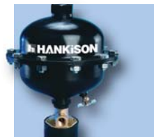
Separador de condensación externo automático Opcional: (13-17)