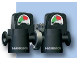
Juegos de acoplamiento en acero inoxidable Opcional (02-17)