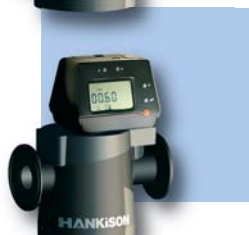
Monitor de filtro Opcional (02-17)