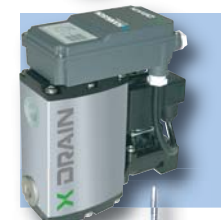
Separador de condensación controlado electrónicamente por niveles X-DRAIN® Opcional: SF (02-08) SXD-1 PF/HF/UF (02-12) SXD-1 SF (09-12) SXD-3 Estándar: PF/HF/UF (13-17) SXD-3 Estándar: SF (13-17) SXD-10