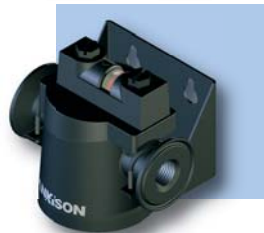
Soporte de pared Opcional (02-17)