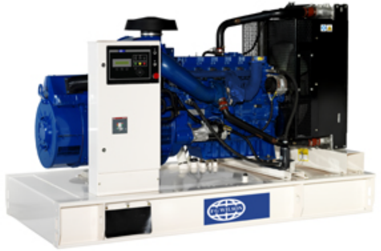
Imagen con finalidad ilustrativa únicamente